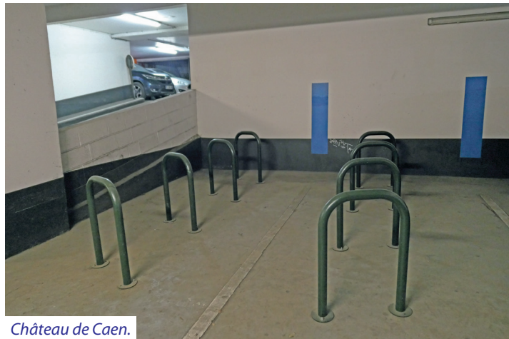
Château de Caen.

On accède au parking vélo depuis l’avenue de la Libération. Signalétique particulière pour les vélos. On descend par la voie de gauche un raidillon et il faut encore parvenir un étage plus bas en allant tout droit pour accéder au niveau du parking.