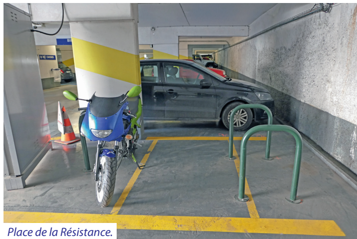
Place de la Résistance.