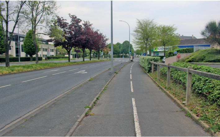
Boulevard Dunois : la piste bidirectionnelle continue.