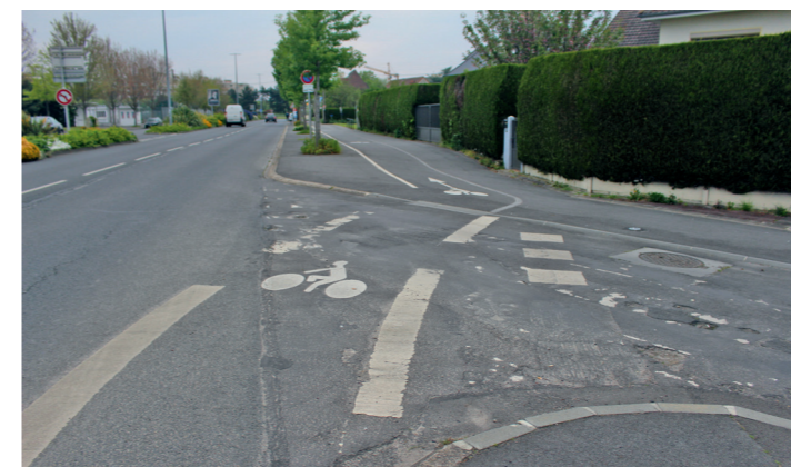
Boulevard Detolle : traversée d'une rue sans nom, annexe au boulevard. La piste monte sur le trottoir.