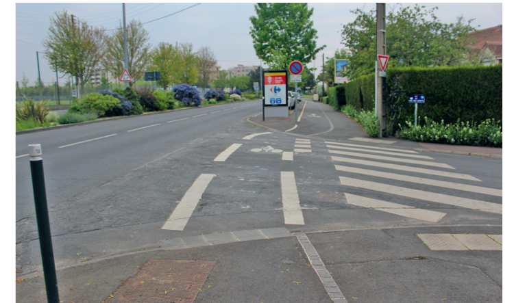
Boulevard Detolle : traversée de la rue du Parc des Sport.

Note : C à cause d'un équipement tronqué.