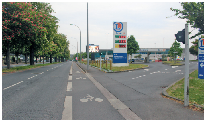
Boulevard Dunois : la piste unidirectionnelle croise l'entrée principale du marché Leclerc. Et plus loin ce sera la sortie.