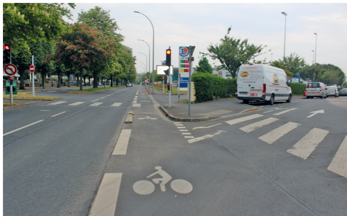
Boulevard Dunois : la piste unidirectionnelle croise la rue Lanfranc.