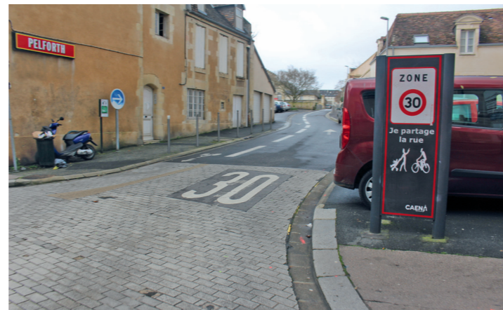
Rue Caponière : arrivée du DSC de la rue Neuve Bourg l'Abbé.

On aime bien les DSC, mais le petit bout de la rue Saint-Ouen (ou Saint-Point) est aussi une bretelle de sortie du boulevard Guillou qui cisaille dangereusement la piste bidirectionnelle. De DSC, cet équipement devrait devenir une simple piste à double sens et la rue qui le définit fermée définitivement à la circulation automobile (voir en 12.1).