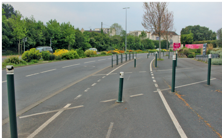
Boulevard Guillou : entrée de la chocolaterie Guilmet (et au fond sortie).