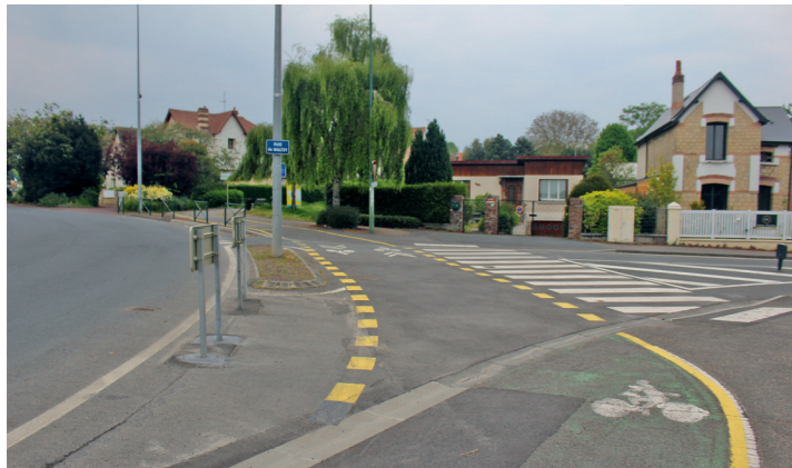
Boulevard Guillou : arrivée sur le rond-point du Zénith. À droite arrivée de la rue de Maltot et au fond départ de la promenade Napoléon 1 er .