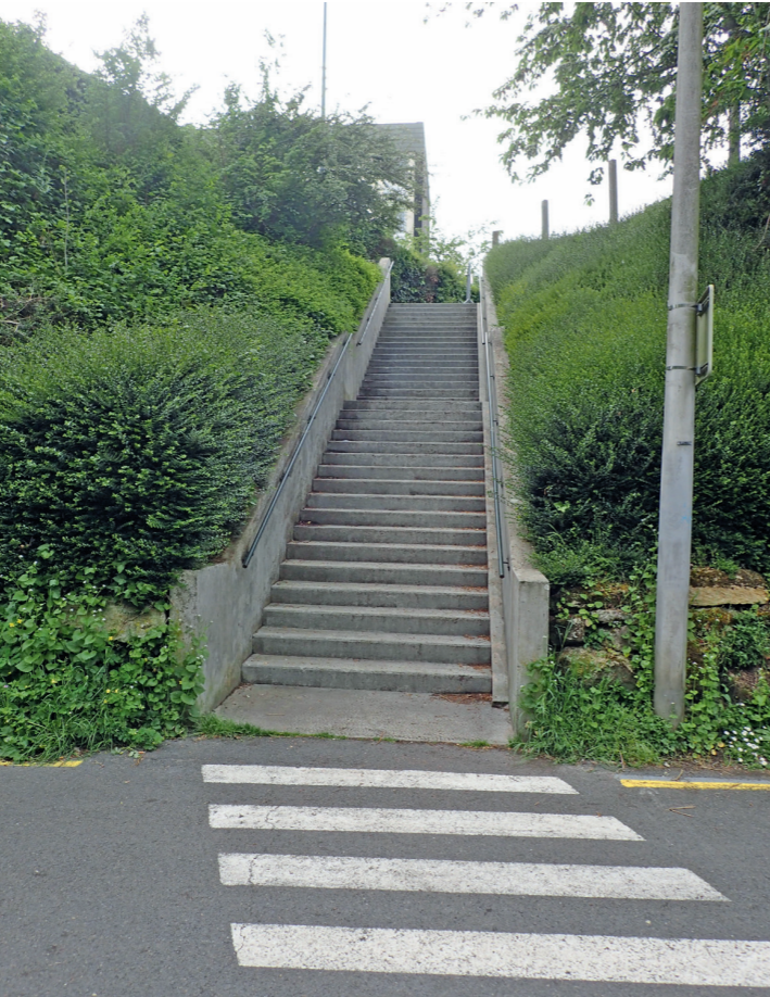
Promenade Napoléon 1 er : l'escalier qui monte à la poste du boulevard Detolle. Il faut porter son vélo.