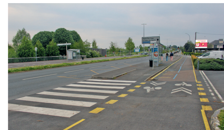
Boulevard Guillo : le cisaillement de la piste au niveau de la boulangerie Paul et du Crédit Mutuel.