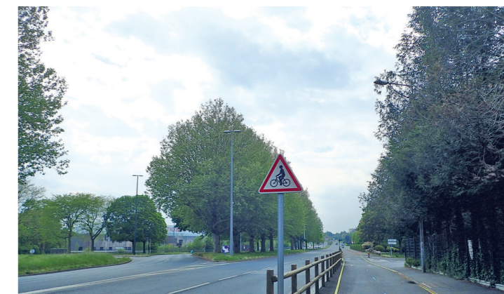
Boulevard Guillaou : une très belle piste bidirectionnelle en site propre, une kyrielle de cisaillements et une litanie de « attention aux cyclistes ! ».