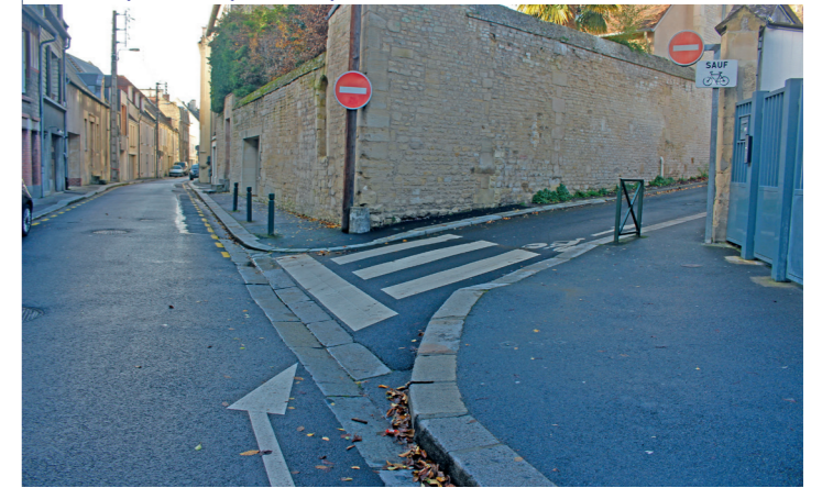
Rue Bicoquet : le départ abrupt du DSC de la rue Saint-Nicolas.