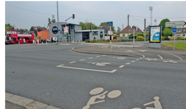
Boulevard Detolle : traversée de la rue Caponière et départ de la piste est du boulevard.