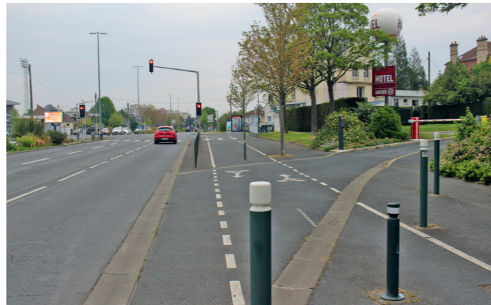
Boulevard Guillou : entrée de l'hôtel Zénith. Si c'est pas du cisaillement ...