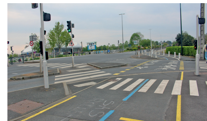
Boulevard Guillaou : le carrefour bien régulé et sécurisé au niveau de l'embranchement avec la rue du Blanc.