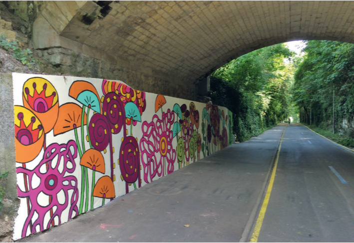
Promenade Napoléon 1 er : tunnel sous la rue Caponière.