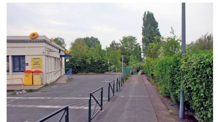
Poste du boulevard Detolle : allée vers l'escalier de la promenade Napoléon 1 er .