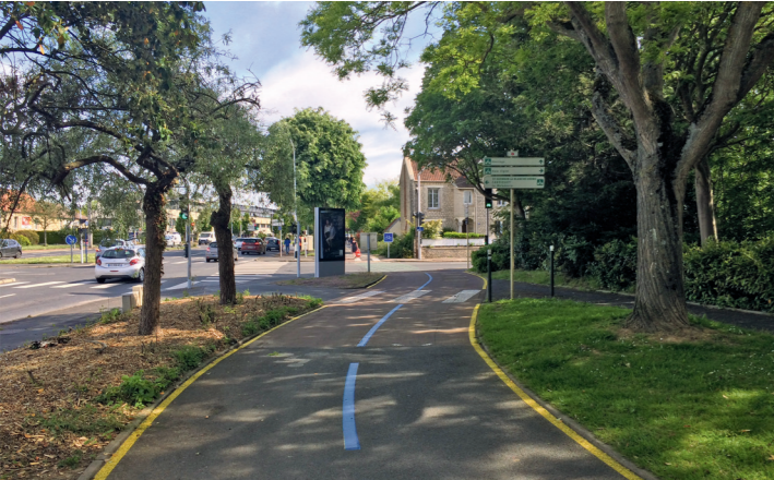
Promenade Napoléon 1 er : l'arrivée sur la rue de Bayeux.