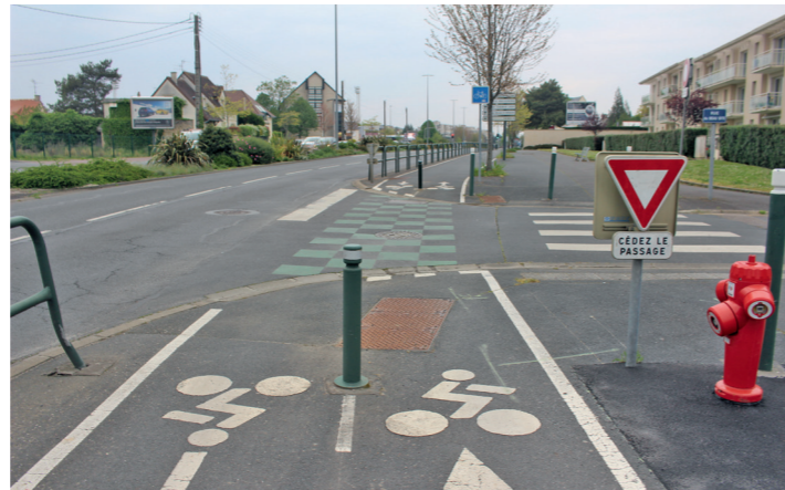
Boulevard Guillou : traversée de la rue du Beau Site.