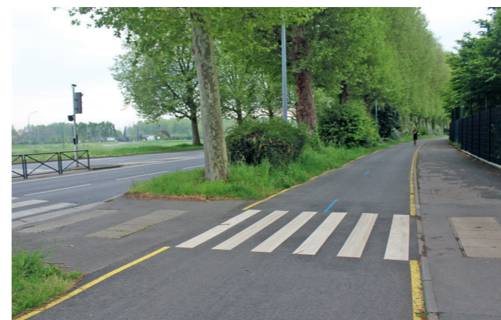
Boulevard Guillo : le départ de la piste au sud de l'avenue Sorel et au dessus du tunnel venant de la Prairie.

Note : C à cause des cisaillements incessants.