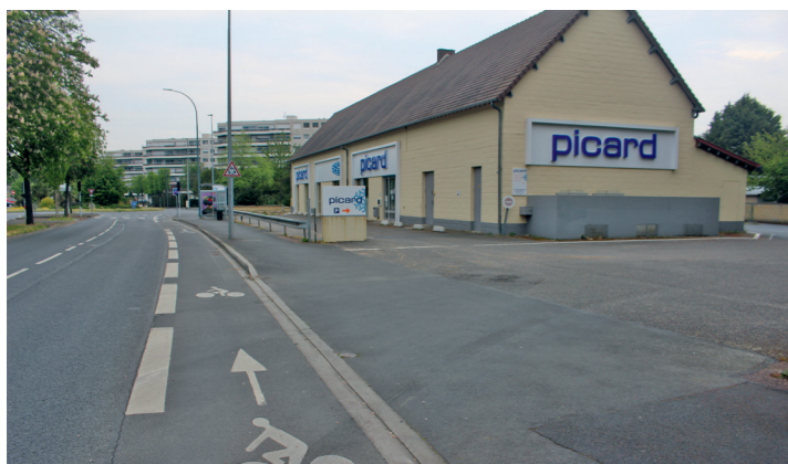
Boulevard Dunois : la piste unidirectionnelle croise une des entrées du magasin Picard et arrive sur le rond-point Saint-Gabriel.