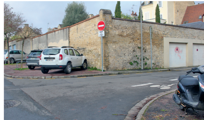
Rue Neuve Bourg l'Abbé : départ sud de la ruelle qui mène à la rue de Bretagne et à la rue de Bayeux.