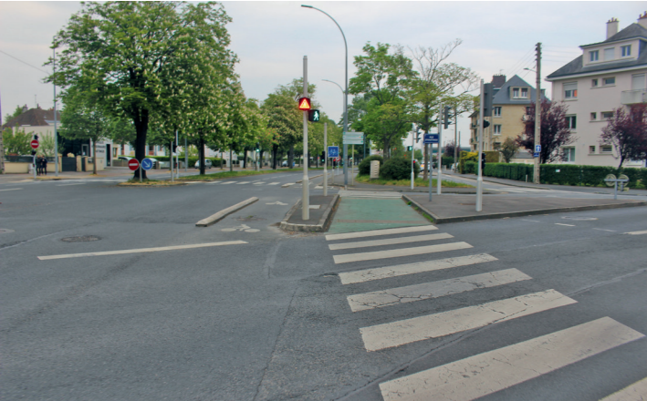
Boulevard Dunois : la piste unidirectionnelle croise la rue d'Hastings.