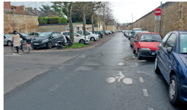
Rue Neuve Bourg l'Abbé : au croisement avec la ruelle qui mène à la rue de Bretagne et à la rue de Bayeux.

On aime bien les DSC, mais le petit bout de la rue Saint-Ouen (ou Saint-Point) est aussi une bretelle de sortie du boulevard Guillou qui cisaille dangereusement la piste bidirectionnelle. De DSC, cet équipement devrait devenir une simple piste à double sens et la rue qui le définit fermée définitivement à la circulation automobile (voir en 12.1).