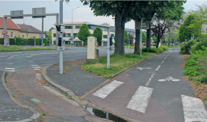
Boulevard Dunois : la bretelle vers la rue d'Authie quitte la piste bidirectionnelle.