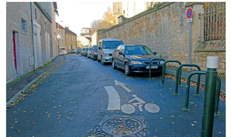
Rue Saint-Nicolas. Au fond à droite l'église Saint-Nicolas.