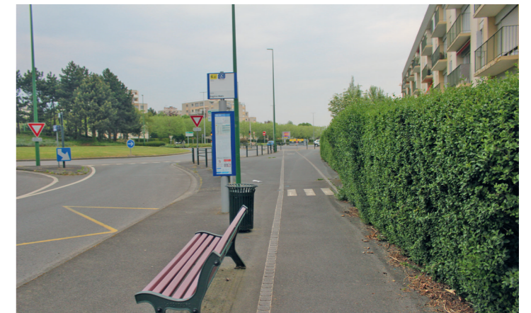
Rue Eugène Maes : station de bus et arrivée sur le rond-point Pompidou.