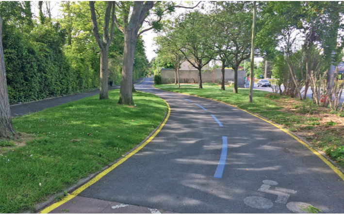
Promenade Napoléon 1 er : belle piste, vive l'empereur !