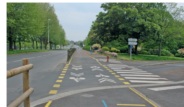
Boulevard Guillou : le cisaillement de la piste au niveau de la rue Saint-Point (Saint-Ouen si l'on veut).