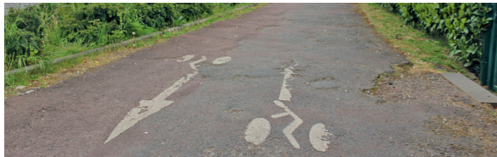
Boulevard Guillou : un petit bout au revêtement très médiocre.