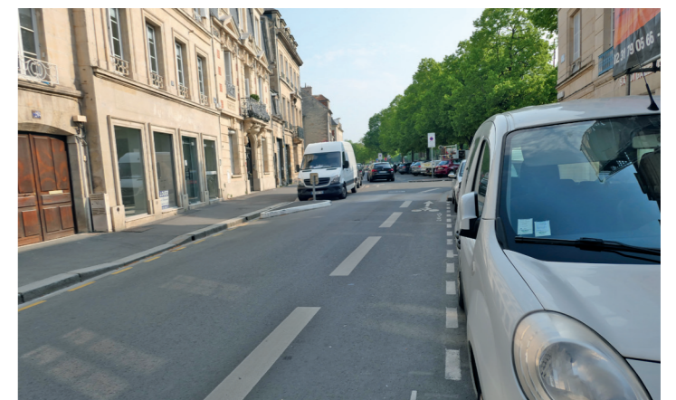
Le petit DSC de la rue Saint-Martin vers la place Saint-Martin.