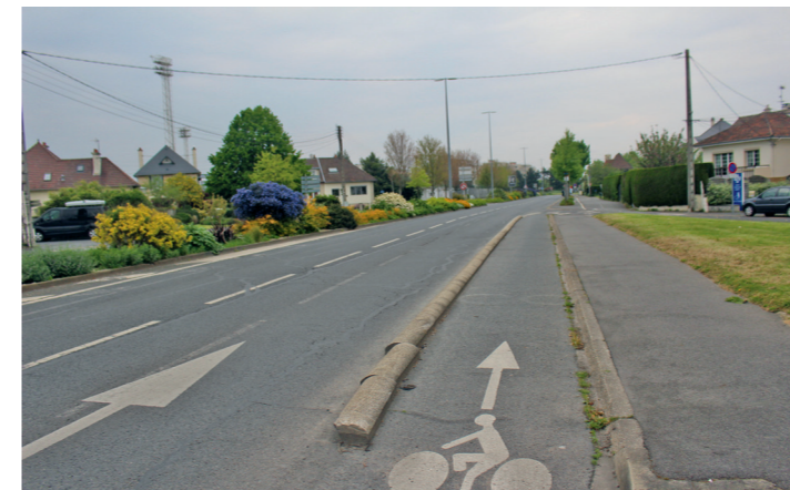
Boulevard Detolle : le petit muret de séparation.