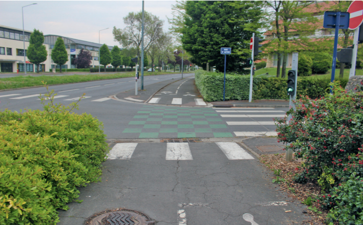
Boulevard Dunois : la piste bidirectionnelle croise la rue d'Authie.

Note : C à cause des cisaillements et d’un équipement cyclable déséquilibré.