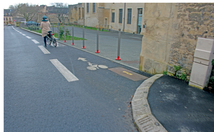
Rue Neuve Bourg l'Abbé : au niveau de la FRAC (à droite).