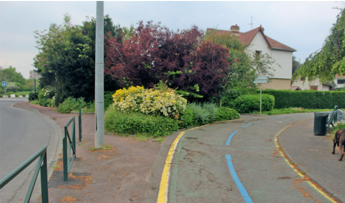
Promenade Napoléon 1 er : on quitte le boulevard Guillou et le rond-point du Zénith.