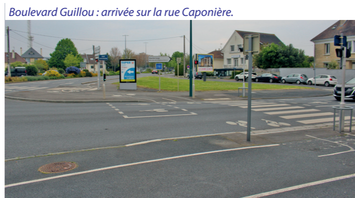
Boulevard Guillou : arrivée sur la rue Caponière.