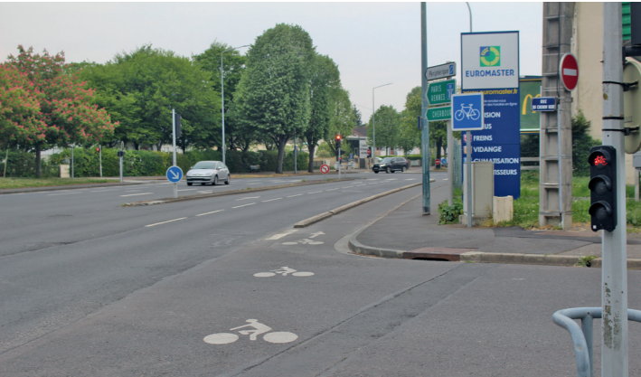
Boulevard Dunois : la piste bidirectionnelle devient unidirectionnelle en croisant la rue du Chemin Vert.