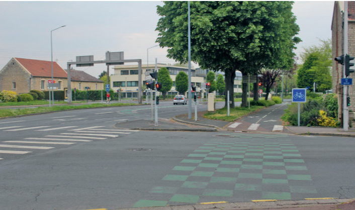
Fin de la promenade Napoléon 1 er , traversée de la rue de Bayeux et départ du boulevard Dunois.