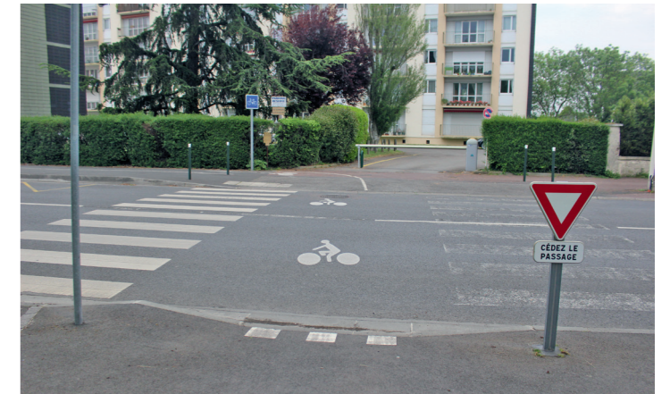
Boulevard Detolle : traversée de la rue Eugène Maes.