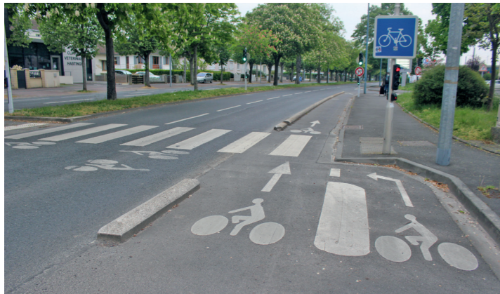
Boulevard Dunois : embranchement vers la piste bidirectionnelle de la rue du Chemin Vert.