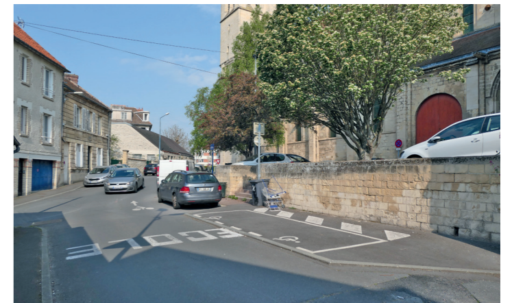
Rue Saint-Nicolas : arrivée devant l'église du même nom.