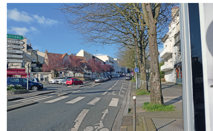
Rue des Cordes (avenue de la Libération) : départ de la bande ascendante.