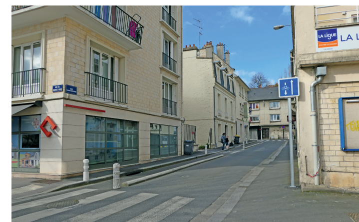
Piste rue Samuel Bochard.