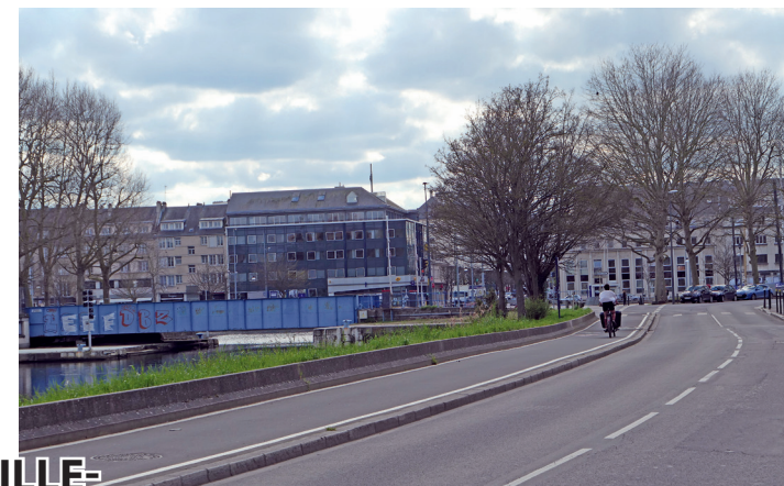
Avenue de Tourville : arrivée sur le pont de la Fonderie.