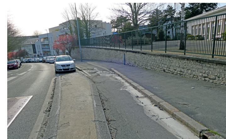
Rue des Cordes : la bande descendante est dangereuse.