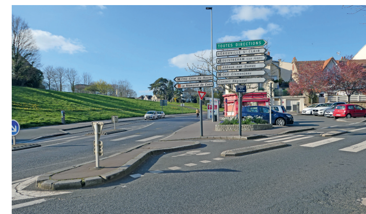
Rue des Cordes (avenue de la Libération) : arrivée tarabiscotée de la bande descendante.