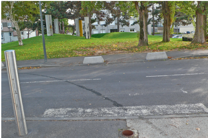
Un cheminement agréable.