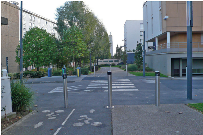
Le croisement avec la rue de Rome.