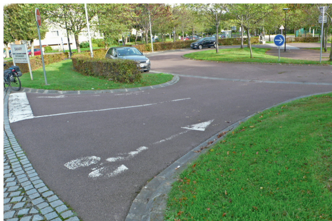
Au rond-point Belles Portes - Grand Parc - Bruxelles : l'entrée vers le petit parking circulaire du collège Varignon.