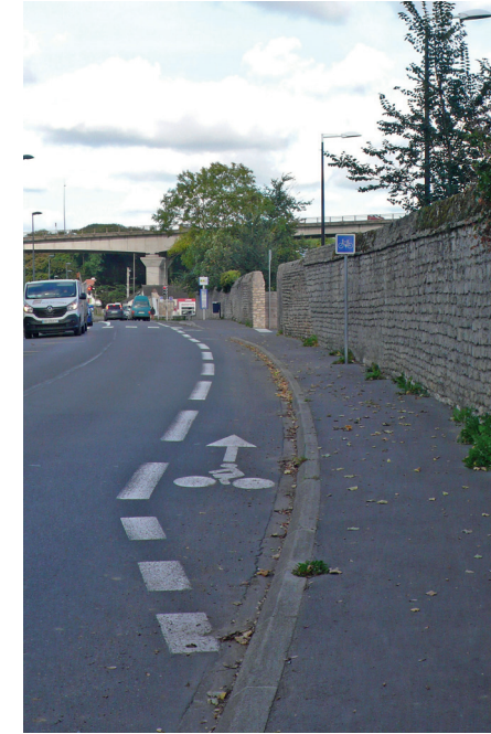
10 - Début du premier tronçon 45 m après la rue de la Rochelle...