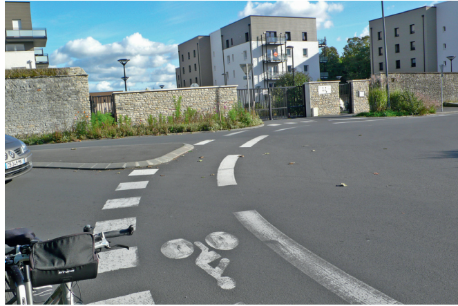
3 - L'entrée dans le rond-point avec l'avenue du Connétable.