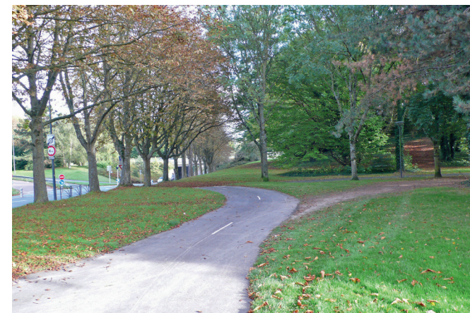
Vers le début de la piste descendante.