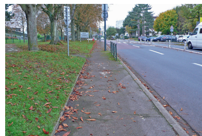
La « piste » montante : - ci-dessus, en venant du quartier de Montmorency ; - ci-dessous, en se dirigeant vers Hérouville centre.