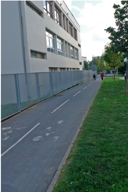
Le long de l'école Saint Michel.