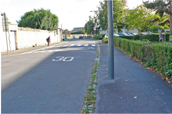
2 - La zone 30 au niveau de la rue du Hamel.