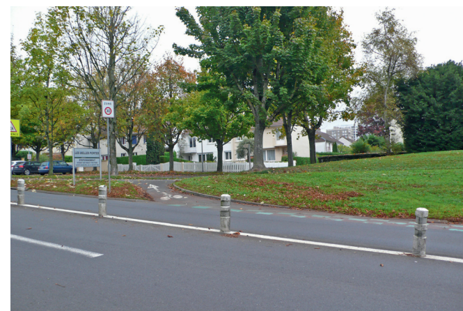
Vers le boulevard des Belles Portes.

Note globale : B en descendant, E en montant.