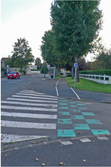
1 - On quitte la rue Eugène Quesnel pour entrer dans le boulevard de la Paix au niveau de la rue Colbert.

Note globale : B pour le « bon » sens (du nord au sud), E dans l’autre sens.