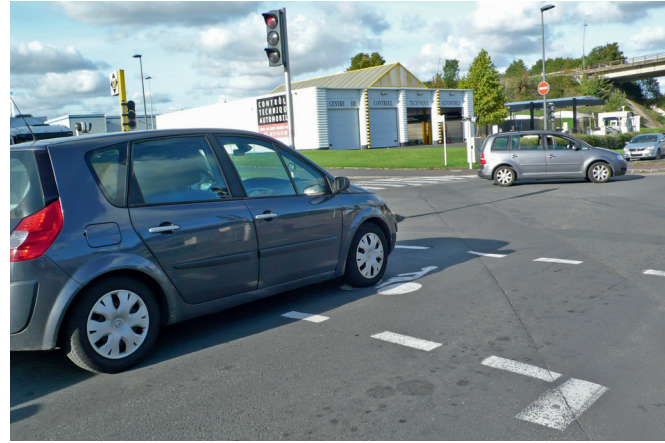
7 - Tant pis pour le sas cycliste.