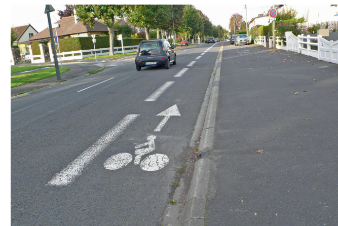
12 - Début de la deuxième portion de piste montante sud-nord, au niveau de la rue du Vieux Manoir.