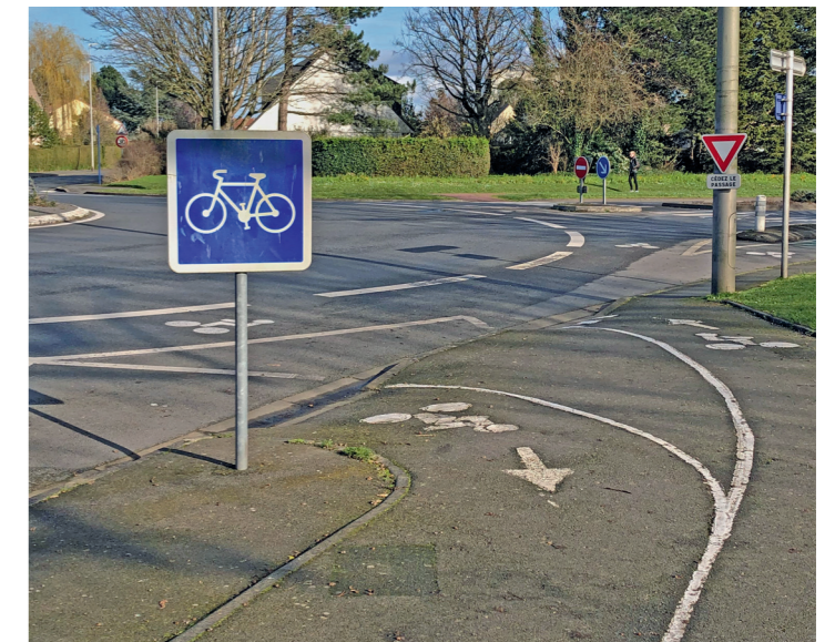
Avenue de Lattre de Tassigny : la double piste rejoint l'avenue de Courseulles.