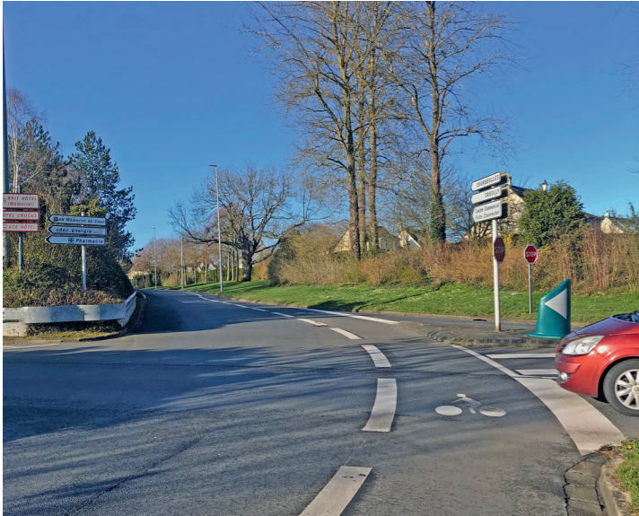
Avenue de Courseulles : le départ de la bretelle cisaillante à la jonction de ses deux origines (Jean Moulin et Brillaud de Laujardière).