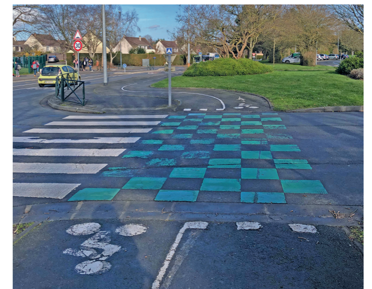
Avenue de Lattre de Tassigny : la double piste de la contre-allée se transforme en piste bidirectionnelle en site propre.