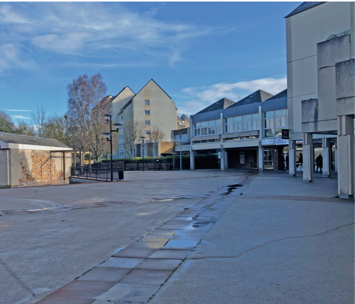
Les trésors piétonniers de la Folie : la rue des Boutiques.