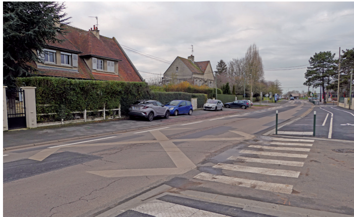
Rue de Mâlon : la piste est.