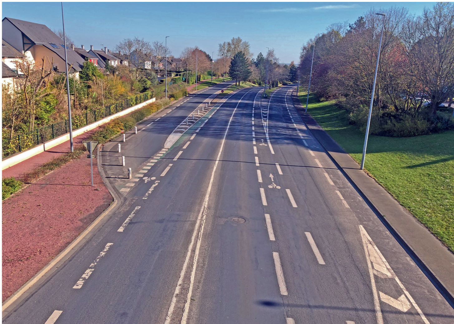
Avenue de Courseulles, vers le sud (centre ville), vue depuis la passerelle de l'Octroi : à droite le cisaillage descendant par la bretelle vers l'esplanade Brillaud de Laujardière, à gauche le cisaillage ascendant vers le boulevard du maréchal Juin.