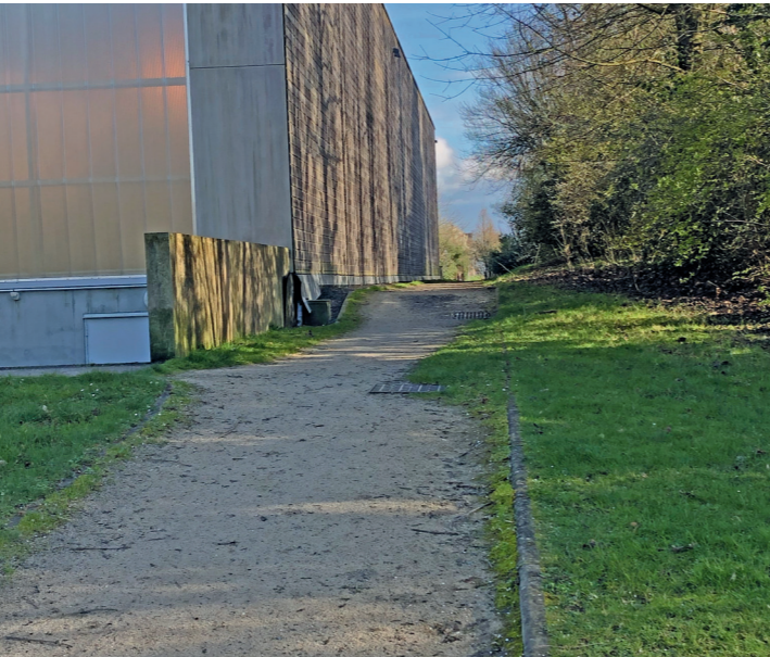
Les trésors piétonniers de la Folie : le long du gymnase Sainte-Ursule.