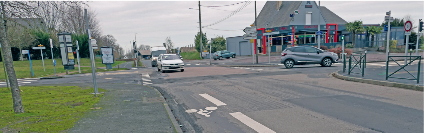
Le carrefour entre la rue de la Folie (à gauche), la rue d'Épron (à droite) et la route de Courseulles (en face) en venant de la rue de Mâlon.