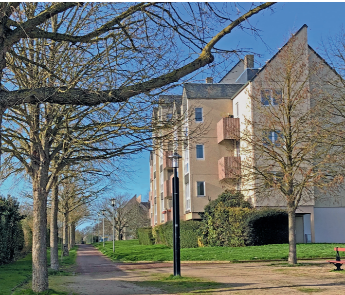
Les trésors piétonniers de la Folie : la promenade Maurice Schumann.

De l’esplanade Brillaud de Laujardière au départ de la rue des Roquemonts : sentier gravillonné rejoignant par 6 pentes assez raides (petits escaliers) l’avenue de Courseulles.