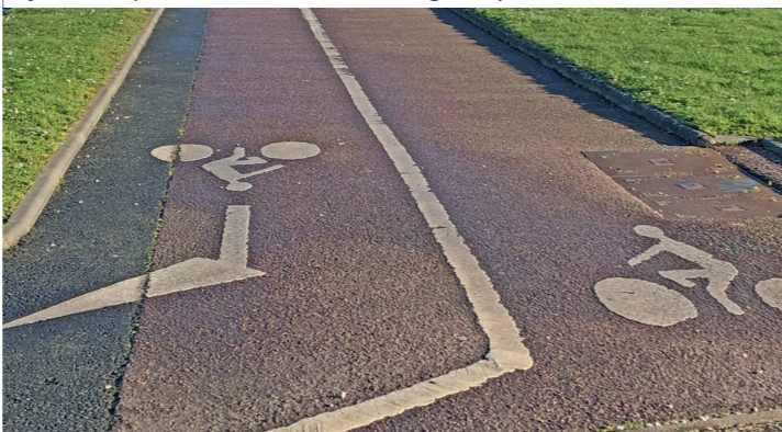
Piste bidirectionnelle rue des Roquemonts : en remontant on doit rejoindre la piste est du boulevard Montgomery devant le Mémorial.