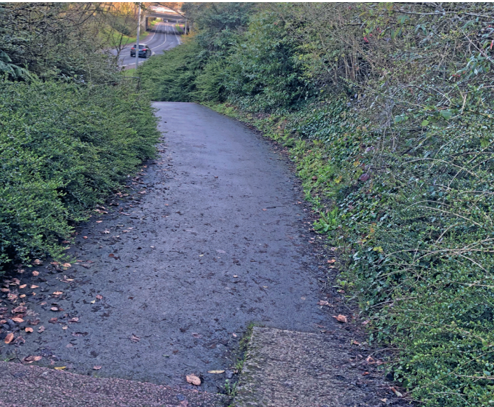
Les trésors piétonniers de la Folie : la descente un peu raide sur l'avenue de Courseulles.