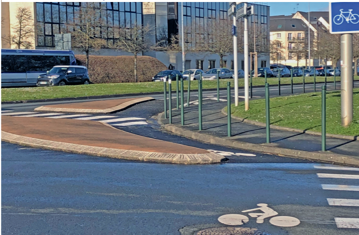
Le départ de la piste sud de l'esplanade Brillaud de Laujardière en contournant la clinique Saint-Martin.