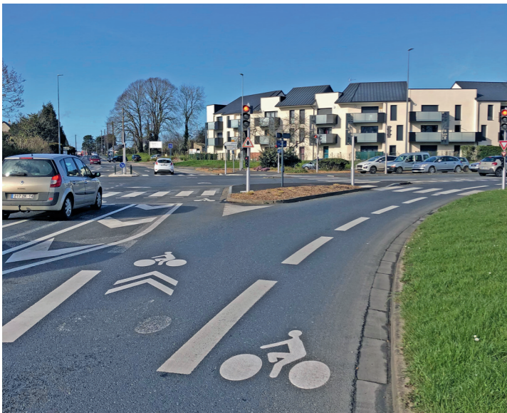
Avenue de Courseulles : l'arrivée nord sur le boulevard du maréchal Juin. En face, la rue de Mâlon.