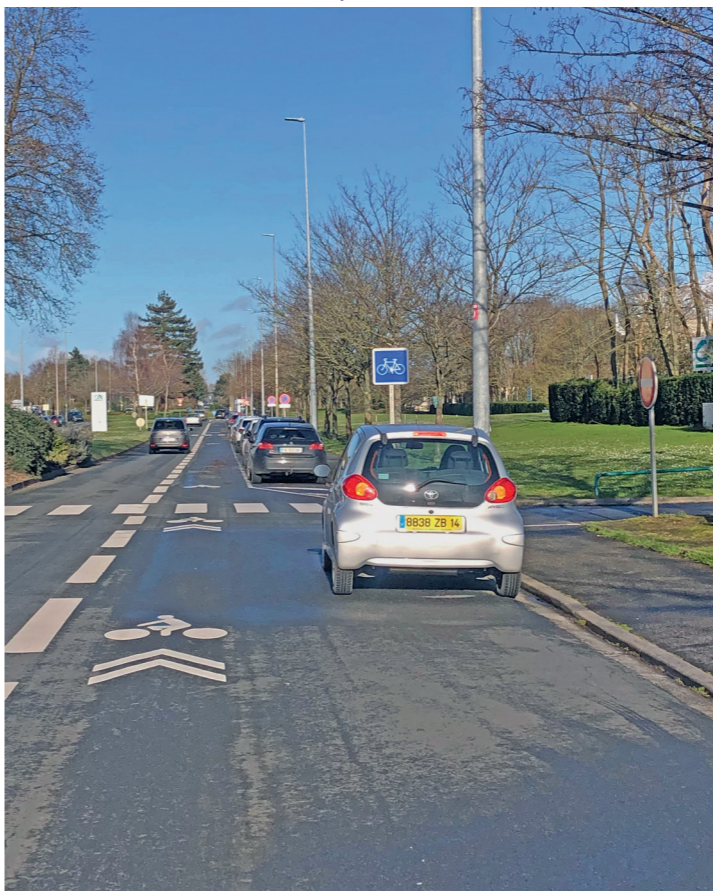
Esplanade Brillaud de Laujardière, piste sud : attention aux voitures en stationnement et à l'ouverture des portières !