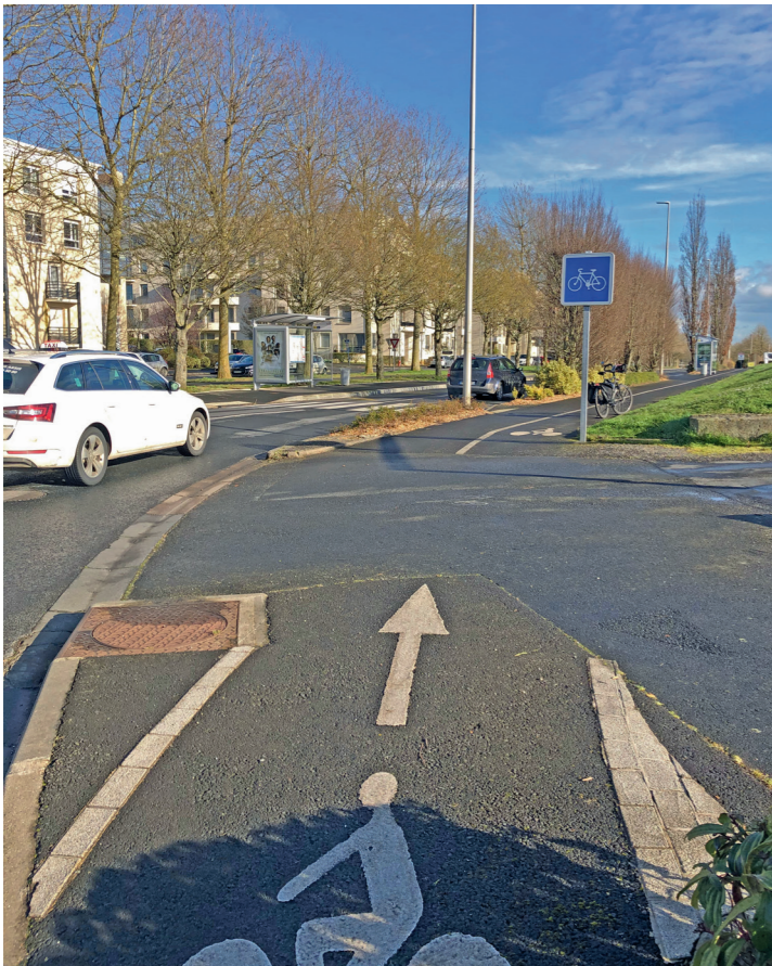
Avenue Montgomery : la piste descendante (ouest) à partir du rond-point de Lattre.