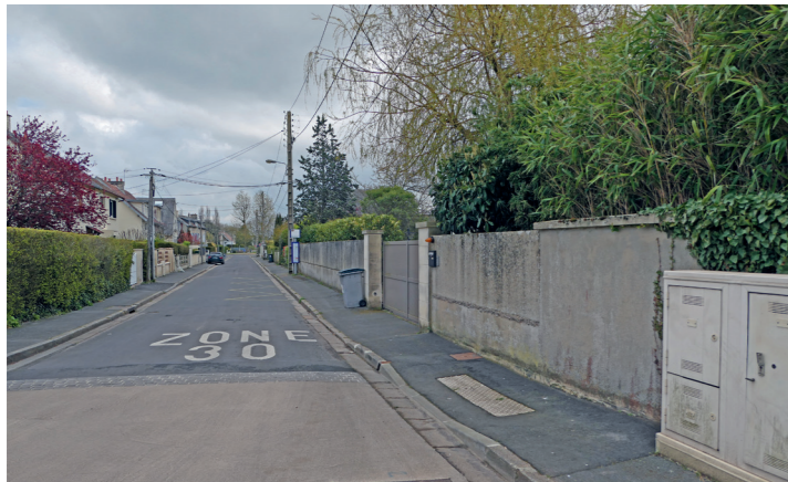
Rue de Couvrechef : entrée nord (rue d'Épron).