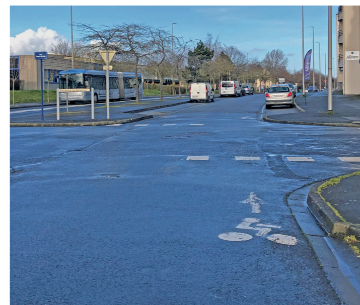
Avenue de Lattre de Tassigny : la double piste dans la contre-allée.