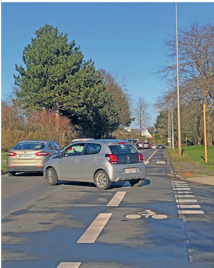
Esplanade Brillaud de Laujardière, piste sud : attention aux voitures qui débouchent !