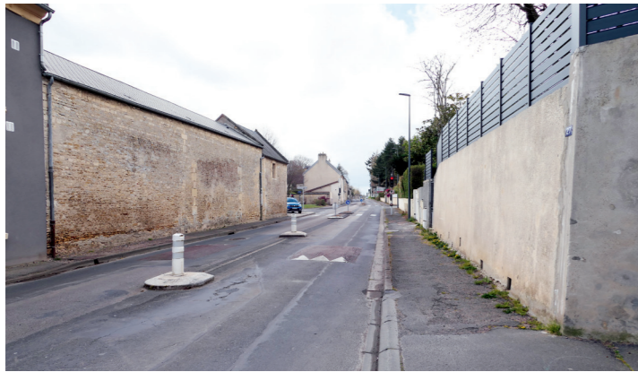
Rue de la Folie : malgré tous les équipements destinés à ralentir la circulation automobile, celle-ci reste importante et trop rapide.