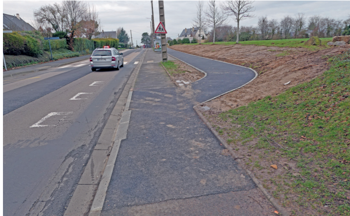
Rue de Mâlon : la bande est monte sur le trottoir et devient une piste.