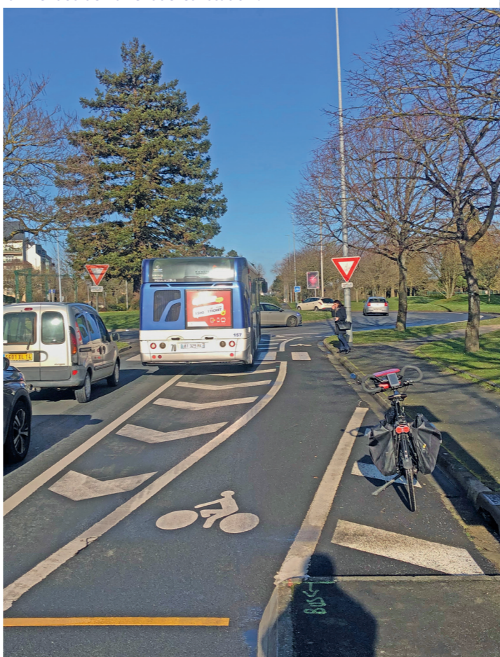
Esplanade Brillaud de Laujardière, piste sud : attention aux bus qui arrivent ou démarrent de leur station !