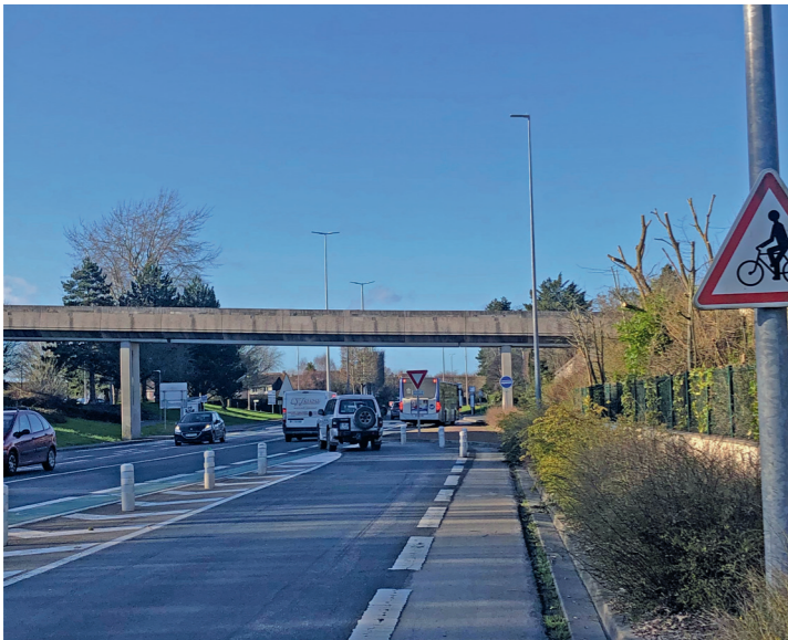
Avenue de Courseulles : l'arrivée de la bretelle cisaillante venant du boulevard Jean Moulin ou de l'avenue Brillaud de Laujardière.