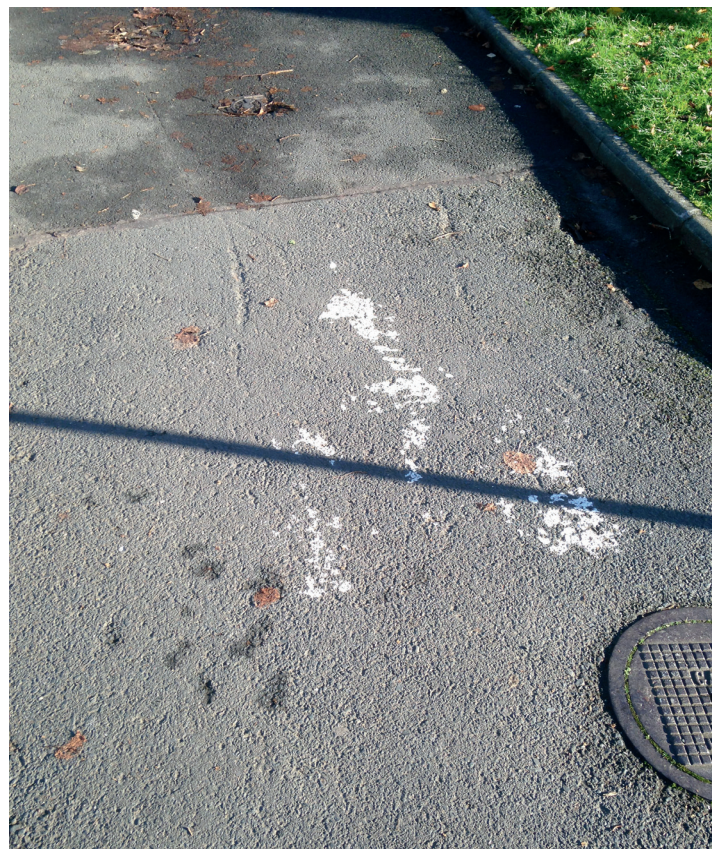
Revêtement médiocre et pictogramme quasi-effacé.