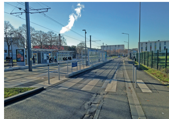
Arrêt de tramway, à la station Rostand-Fresnel.