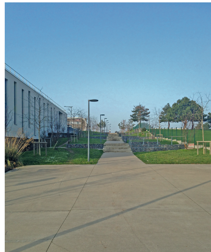
Rampe Rostand-Fresnel en allant vers le nord.