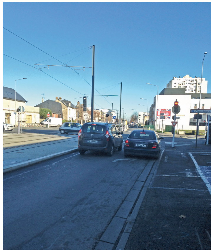
Rue de l'Aviation : un bouchon automobile au débouché Falaise.