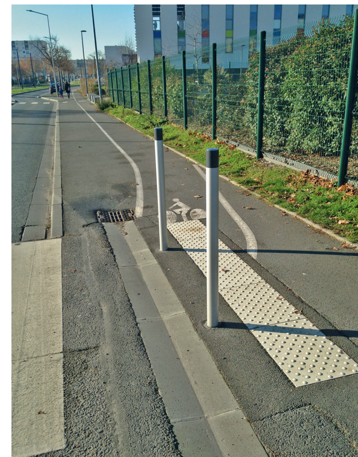
Piste nord sur l'avenue Foucauld, après la station Rostand-Fresnel.