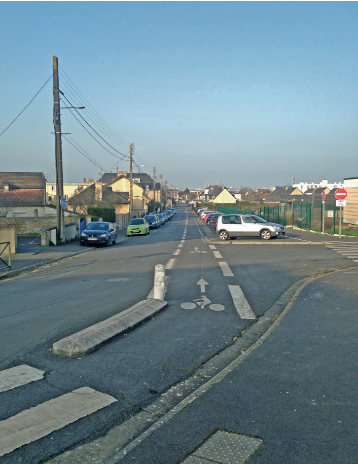
Double sens cyclable sud-nord rue Eustache Restout.