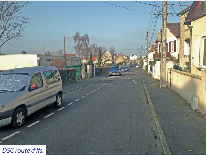
DSC route d'Ifs.

Un petit passage étroit entre la rue des Jonquilles et la route d'Ifs serait pratique s'il n'était pas entravé par des barrières.