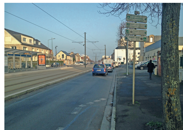
Rue de l'Aviation : débouche sur la rue de Falaise.