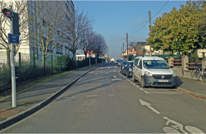
Entrée dans la route d'Ifs vers le centre ville.