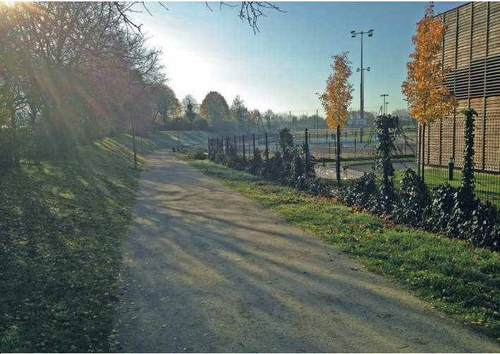
Départ de la voie verte entre le lycée Rostand et la chaufferie à bois.

Pour cette raison, avec regret, note : E.