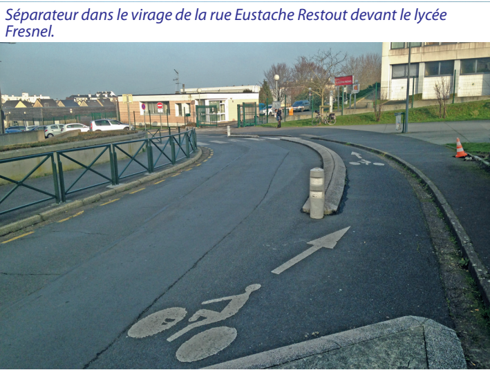
Séparateur dans le virage de la rue Eustache Restout devant le lycée Fresnel.