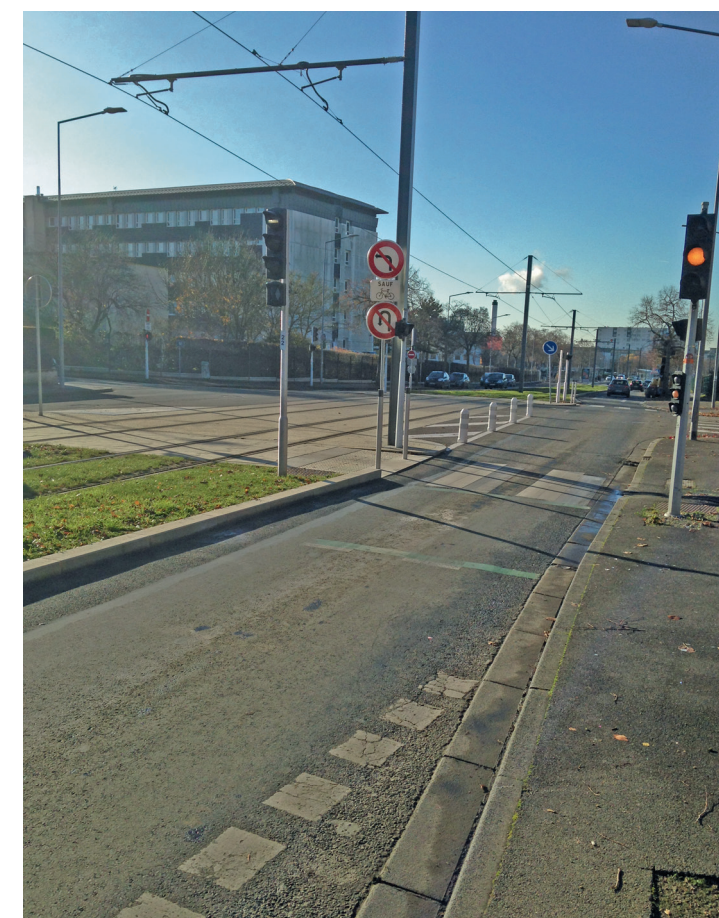
Fin de la bande cyclable, nord de la rue de l'Aviation.