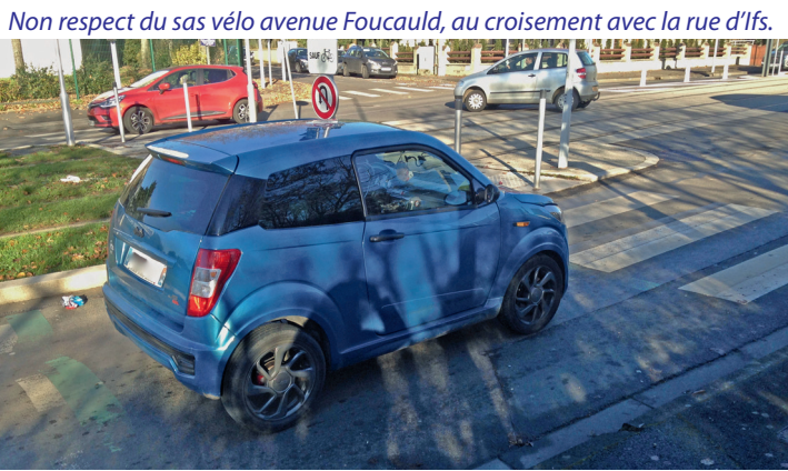
Non respect du sas vélo avenue Foucauld, au croisement avec la rue d'Ifs.

C'est une partie de la belle piste cyclable bi-directionnelle qui relie Caen, Fleury et Ifs.