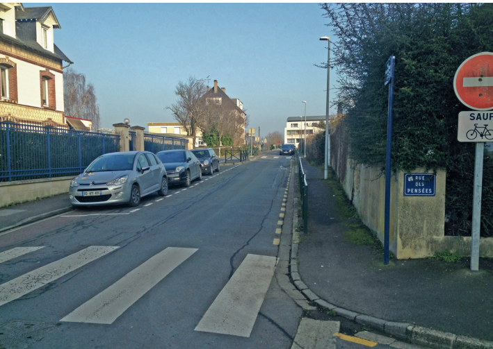
Double sens cyclable est-ouest rue Eustache Restout.