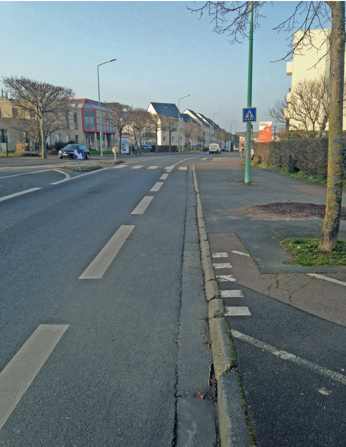
Débouché de la piste cyclable nord de l’avenue Foucauld sur la rue Armand Marie.

Les 130 mètres qui desservent l’accès au lycée Fresnel et à l’école Eustache Restout bénéficient d’un double-sens cyclable remarquablement bien conçu, avec séparateur dans le virage. Bonne signalisation.