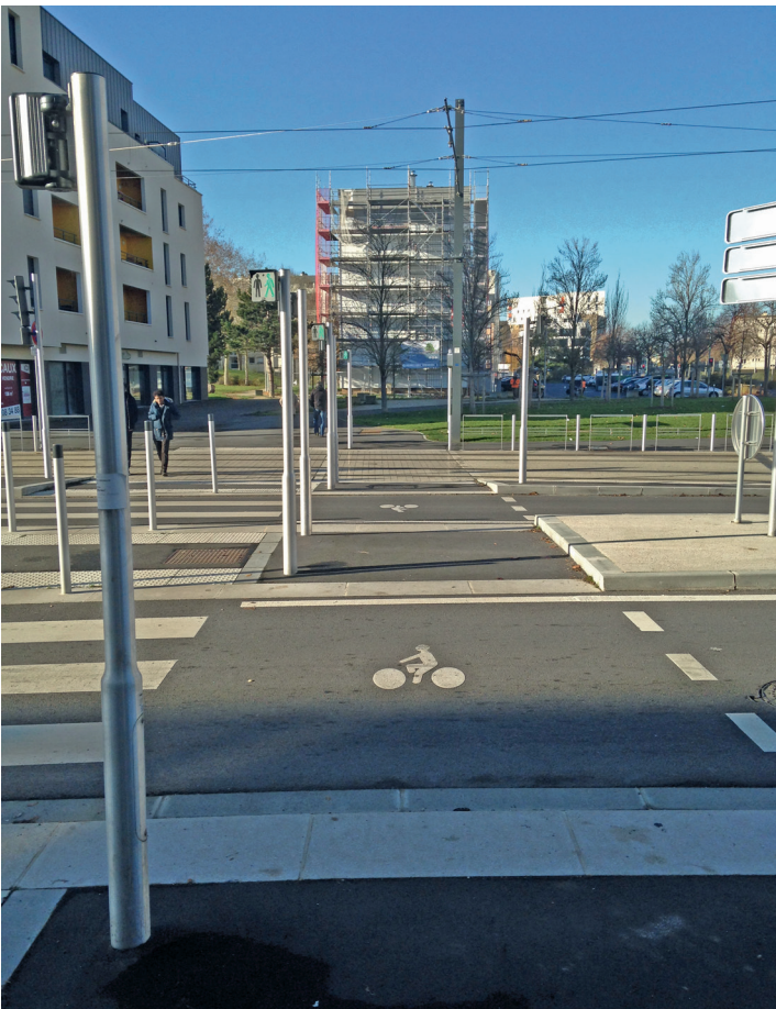
Traversée de l'avenue du général Laperrine.

Très calme et agréable. Dommage qu'il débouche sur la rue Eustache Restout qui est dangereuse.