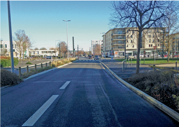
Avenue du général Laperrine en arrivant sur l'avenue Foucauld.