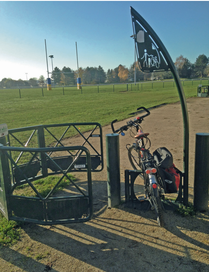
Un des pièges à vélo sur la voie verte.