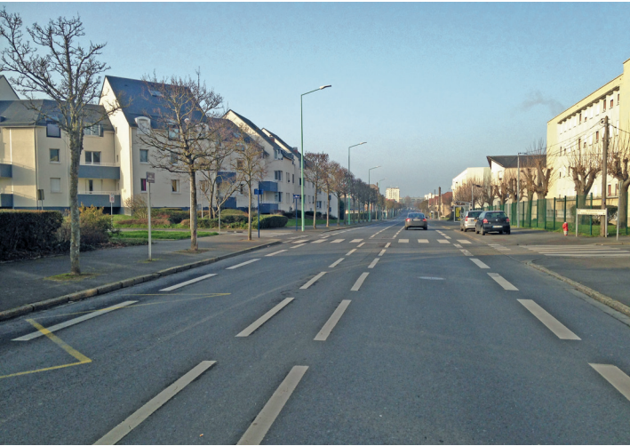
Rue Armand Marie.