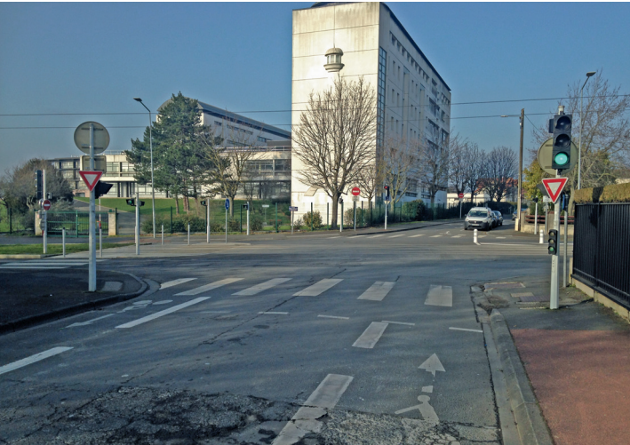
Carrefour Ifs-Foucauld-Aviation. En face le lycée Fresnel.