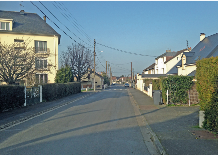
Partie nord de la rue Eustache Restout vers le boulevard Lyautey.

Globalement, ce quartier à la géographie très favorable et parcouru par de nombreux scolaires, collégiens et lycéens, mériterait plus d’attention pour devenir vraiment cyclable.