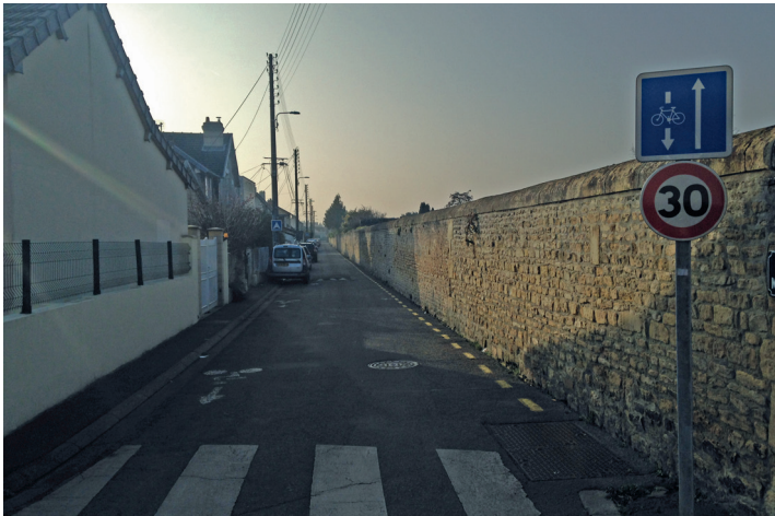
DSC de la rue Marchaud.

Bel aménagement, avec un séparateur bienvenu devant l'école.