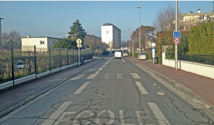
Route d'Ifs devant le Lycée Rostand.