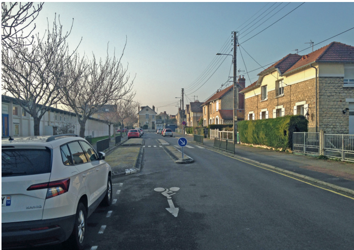
DSC de la rue Louis Lechatellier.