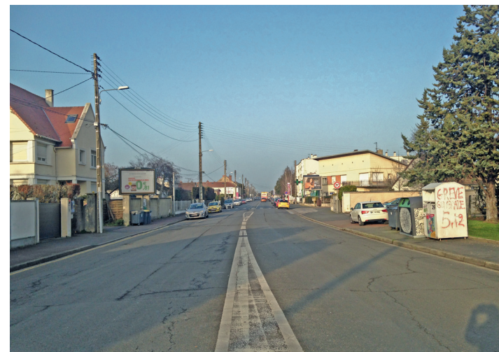
L'avenue d'Harcourt, vers le nord.