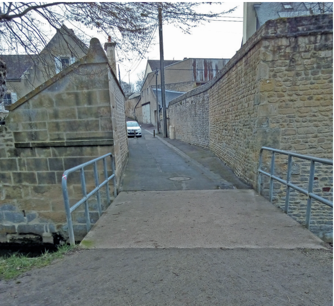
Le ponts sur le petit Odon.