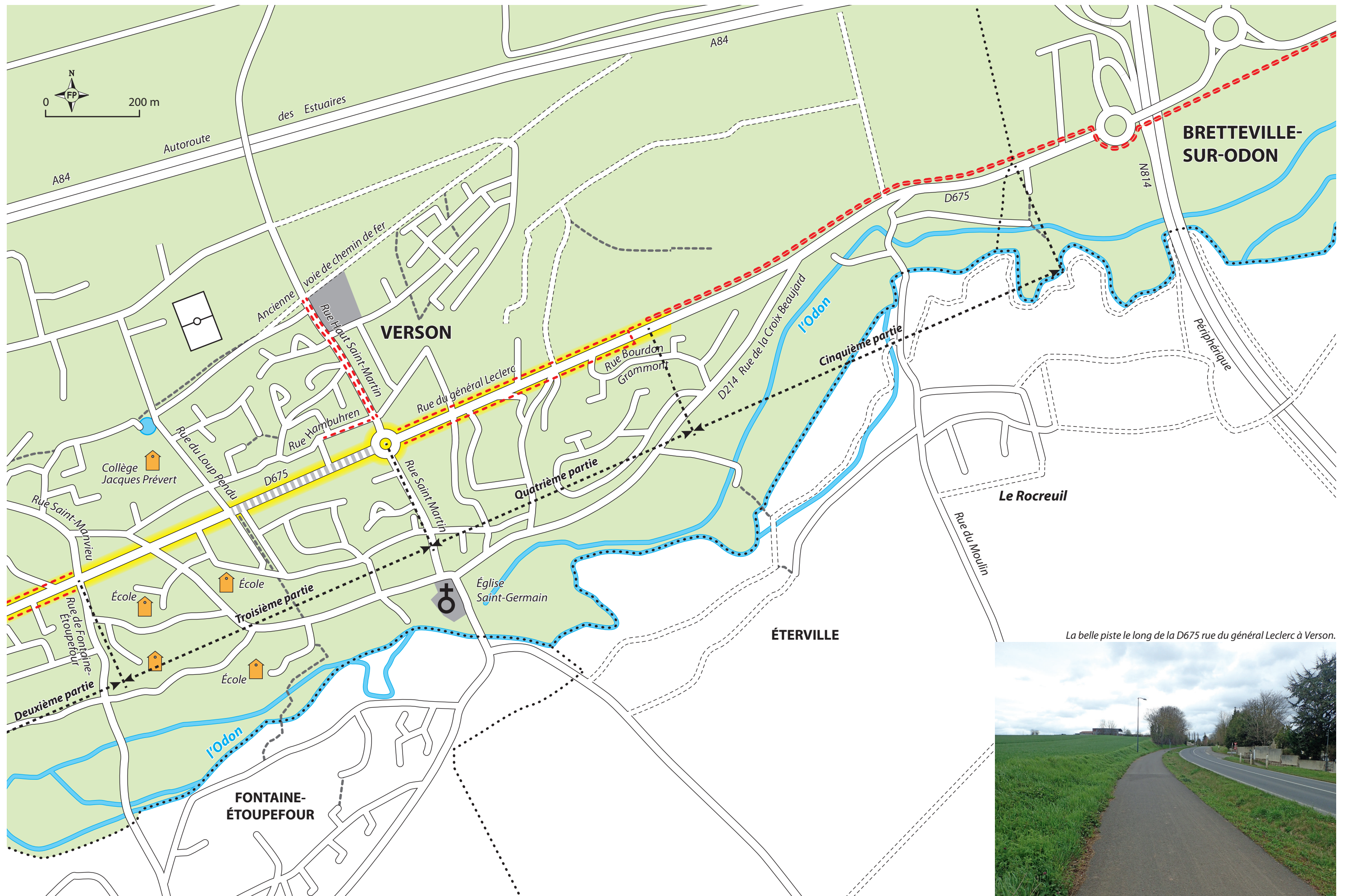
La belle piste le long de la D675 rue du général Leclerc à Verson.