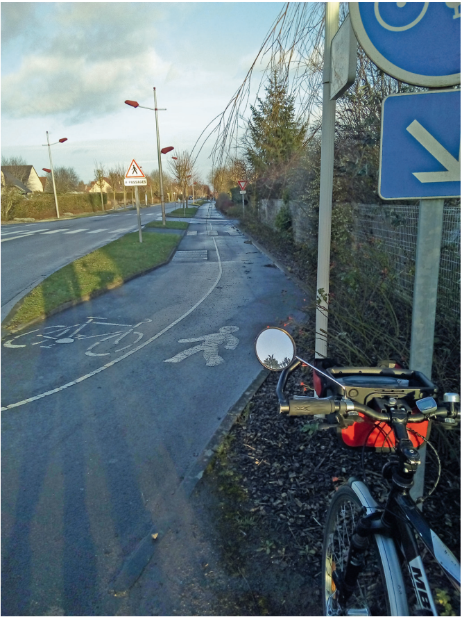
Ci-dessus, l’entrée au rond-point de Buk de la 1 ère partie de la piste sud de la rue du général Leclerc. Ci-dessous, 2 ème partie au sortir du carrefour avec la rue du Hameau Foulon.