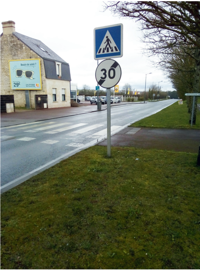
Le départ de la bande cyclable de la rue Haut Saint Martin.

La piste sud de la rue du général Leclerc - 4 ème partie : - en haut à gauche, quelques mètres après la rue Saint Martin et le bureau de tabac ; - ci-contre, une des rues affluentes sur la gauche avec des petits sauts de trottoir un peu rudes ; - ci-dessous à droite, la fin de la piste sud, juste après la rue Bourdon Grammont, avant de traverser la route pour rejoindre la rive nord de la D675. On peut noter qu’on sort d’une zone 30, qu’il faut faire attention aux piétons (et peut-être aussi aux cyclistes). Le garage Renault est au fond à gauche, juste avant le départ de la très belle piste à double sens reliant Versen et Bretteville-sur-Odon.