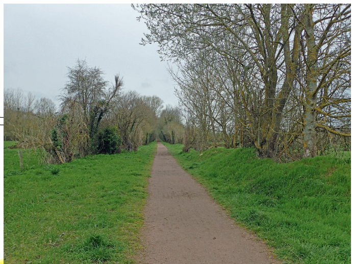
L'ancienne voie ferrée de Louvigny à Bretteville-sur-Odon, en partant du Mesnil de Louvigny.