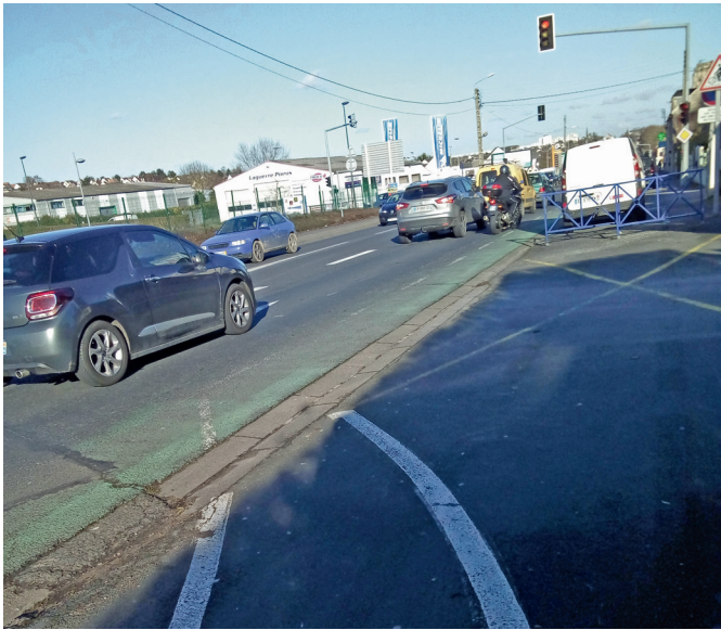
La belle piste de la D675 se termine d’une façon bien moche.