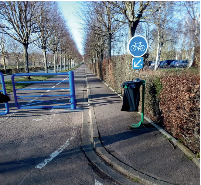
La piste le long de l’avenue des Canadiens.