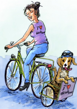
illustration : associinolin.free.fr